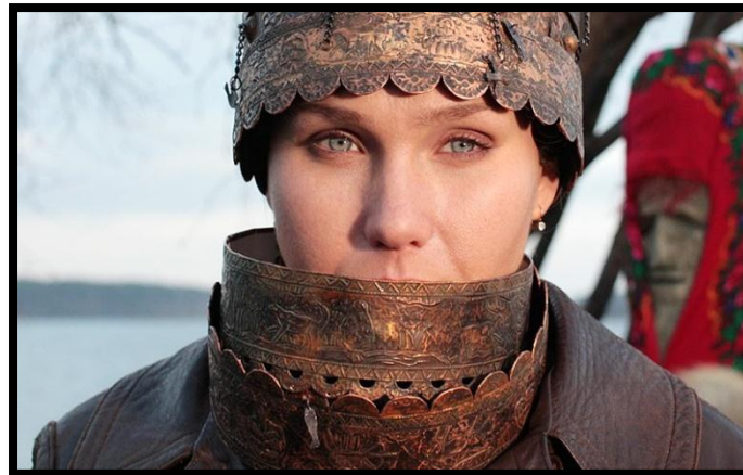
Рис.19. Кадр из к/ф