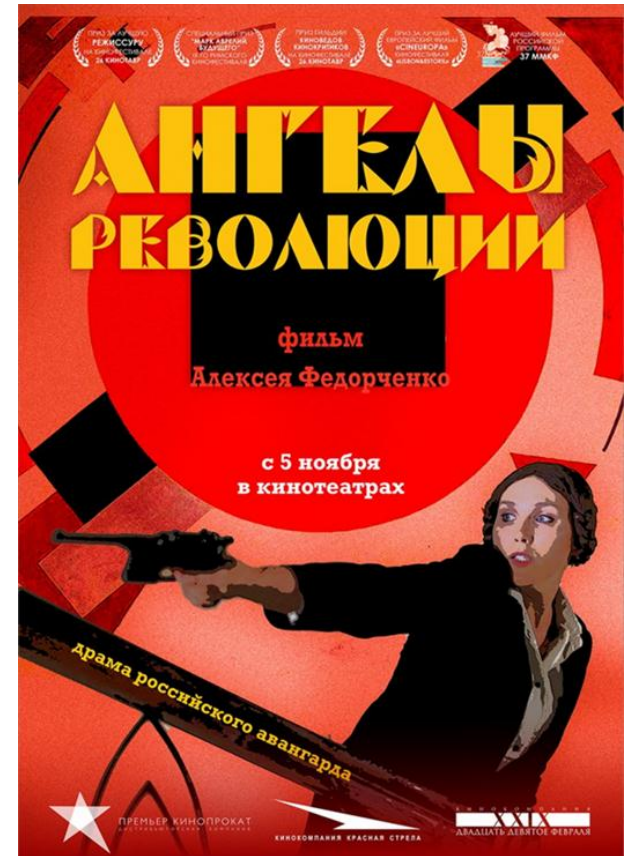
Рис.2. Афиша фильма «Ангелы революции»