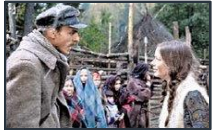
Рис. 14, 15. Кадры из фильмов