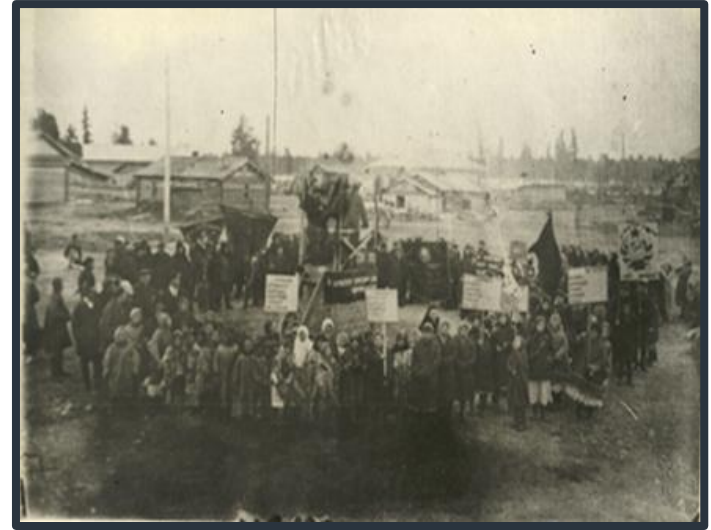
Рис.. 17. Кадр из к/ф. Празднование 17 годовщины Великой Октябрьской революции