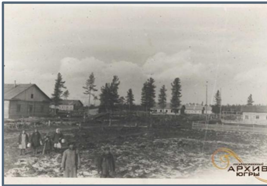
Фото 3. Строительство культурной базы