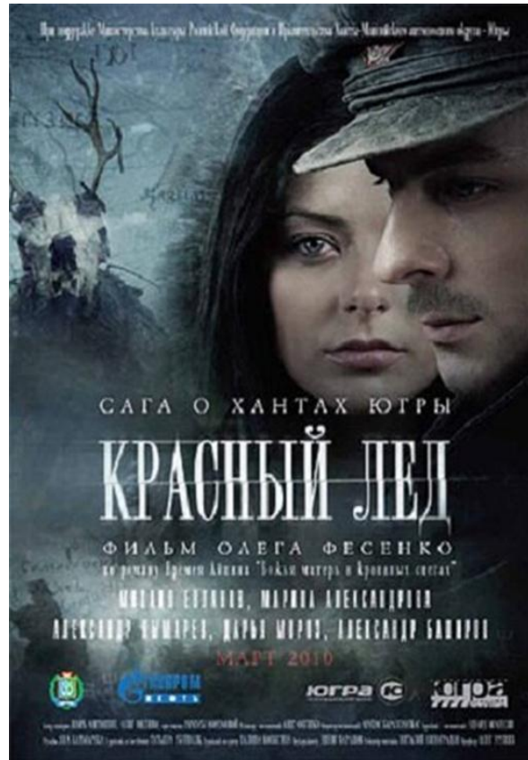
Рис.1. Афиша фильма «Красный лед»