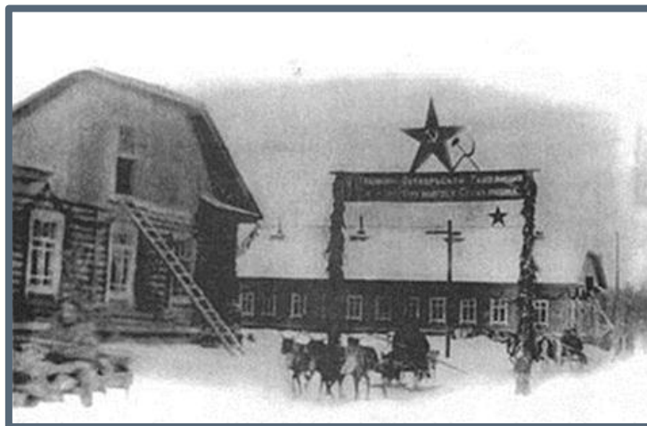
Фото 5. Открытие Казымской культбазы