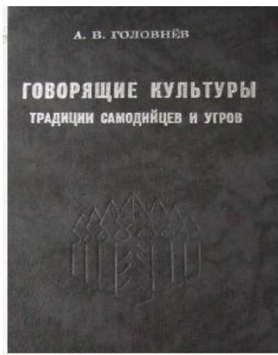
Рис.5. Книга А. Головнева «Говорящие культуры»