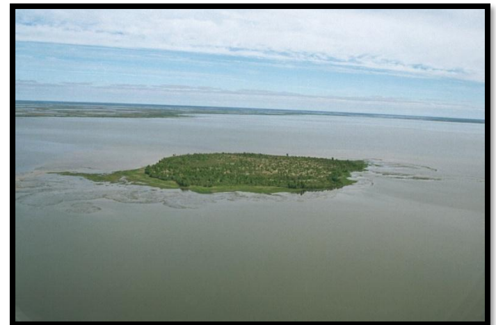
Фото 10. Озеро Нумто

13 марта 1934 г. Постановление бюро Остяко-Вогульского окружкома ВКП(б) «О ликвидации контрреволюционного кулацкого восстания на Казыме».