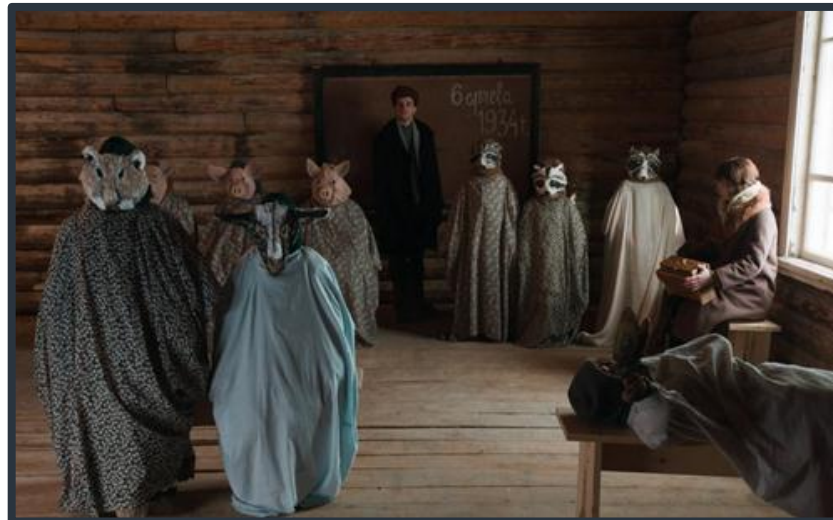
Рис.18. Кадр фильма «Ангелы революции». Театрализованное представление в школе