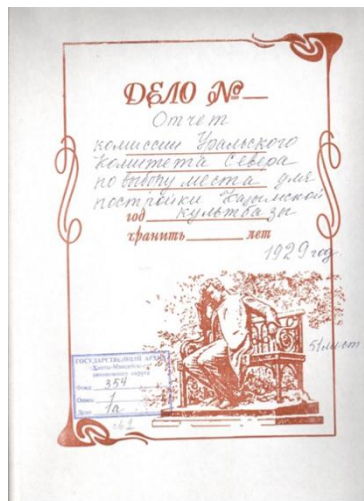
Рис.3. Архивные документы