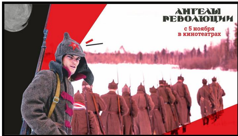
Рис. 11-13. Кадры из фильма «Ангелы революции»