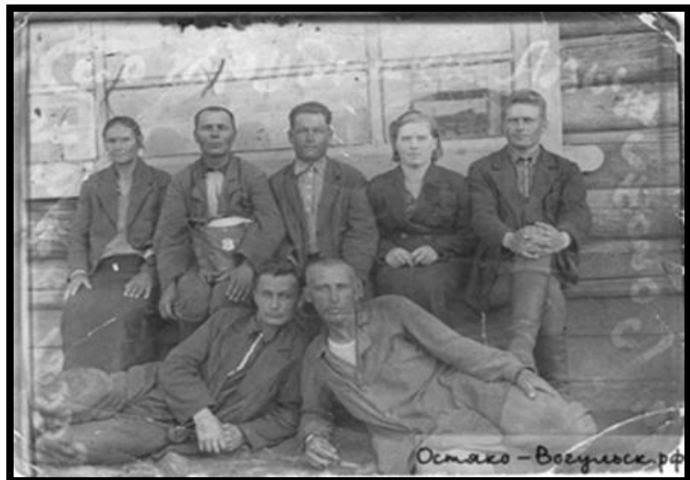
Фото 6. Коллектив культбазы