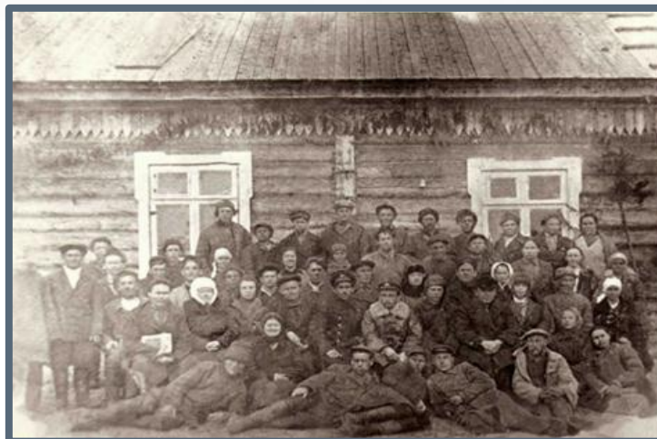
Фото 4. Коллектив культбазы