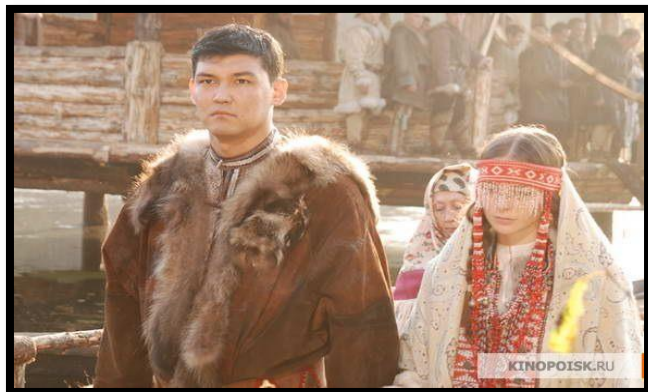
Рис. 8-10. Кадры из фильма «Красный лёд. Сага о хантах Югры»