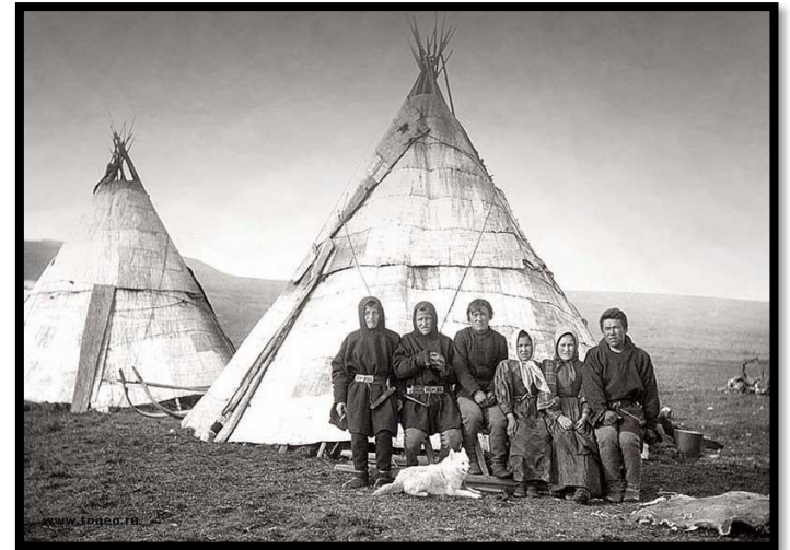
Фото 2. Местные жители, 1930 г.