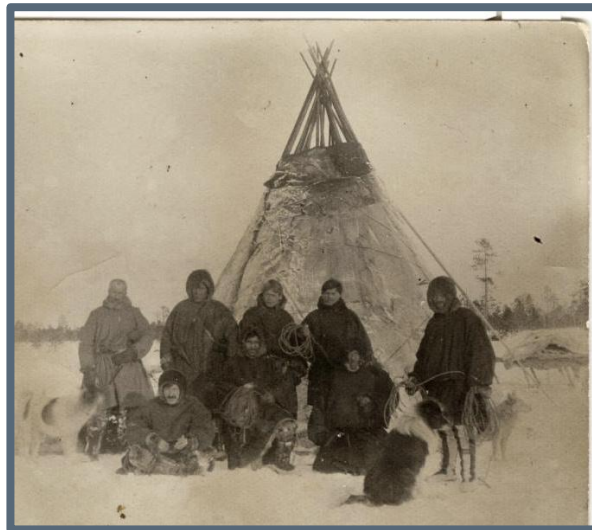
Фото 8. Группа местных жителей во время подавления Казымского восстания