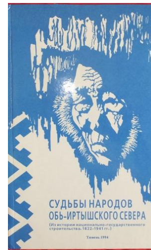
Рис.4. Сборник документов «Судьбы народов Обь-Иртышского Севера»