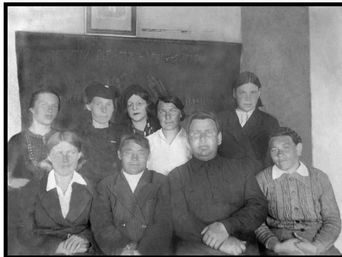
Фото 7. Активисты Казымской культбазы

Казымская культбаза существовала с 14 ноября 1931 г. по 1960 г.