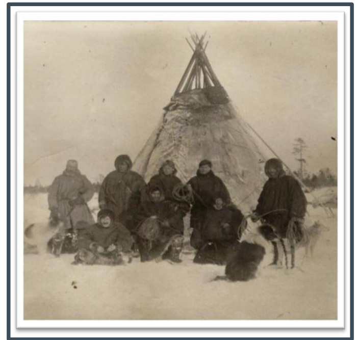
Фото 1. Местные жители, 1930 г.