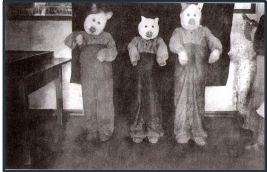
Фото 11. Казымская культбаза. Театрализованное представление в школе- интернате