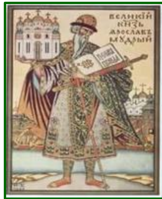
Князь Ярослав Мудрый

В библиотеке около 500 томов, в ней имелись Евангелие, книги пророков, жития святых, важные государственные документы.