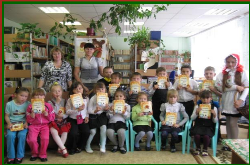
2010 г. «В гостях у сказки».