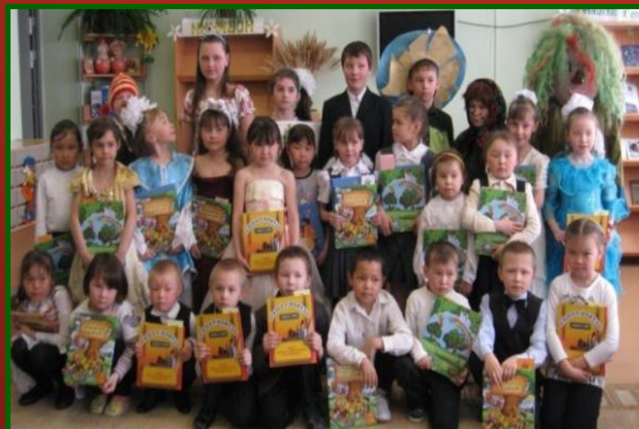
2014 г. Посвящение в читатели.