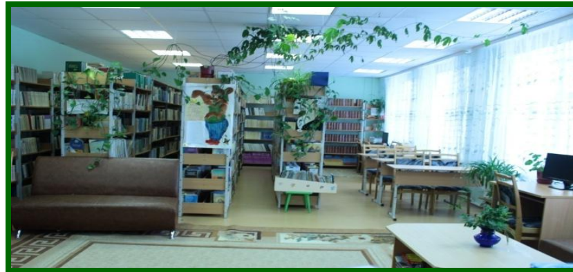
Читальный зал библиотеки СОШ с. Казым