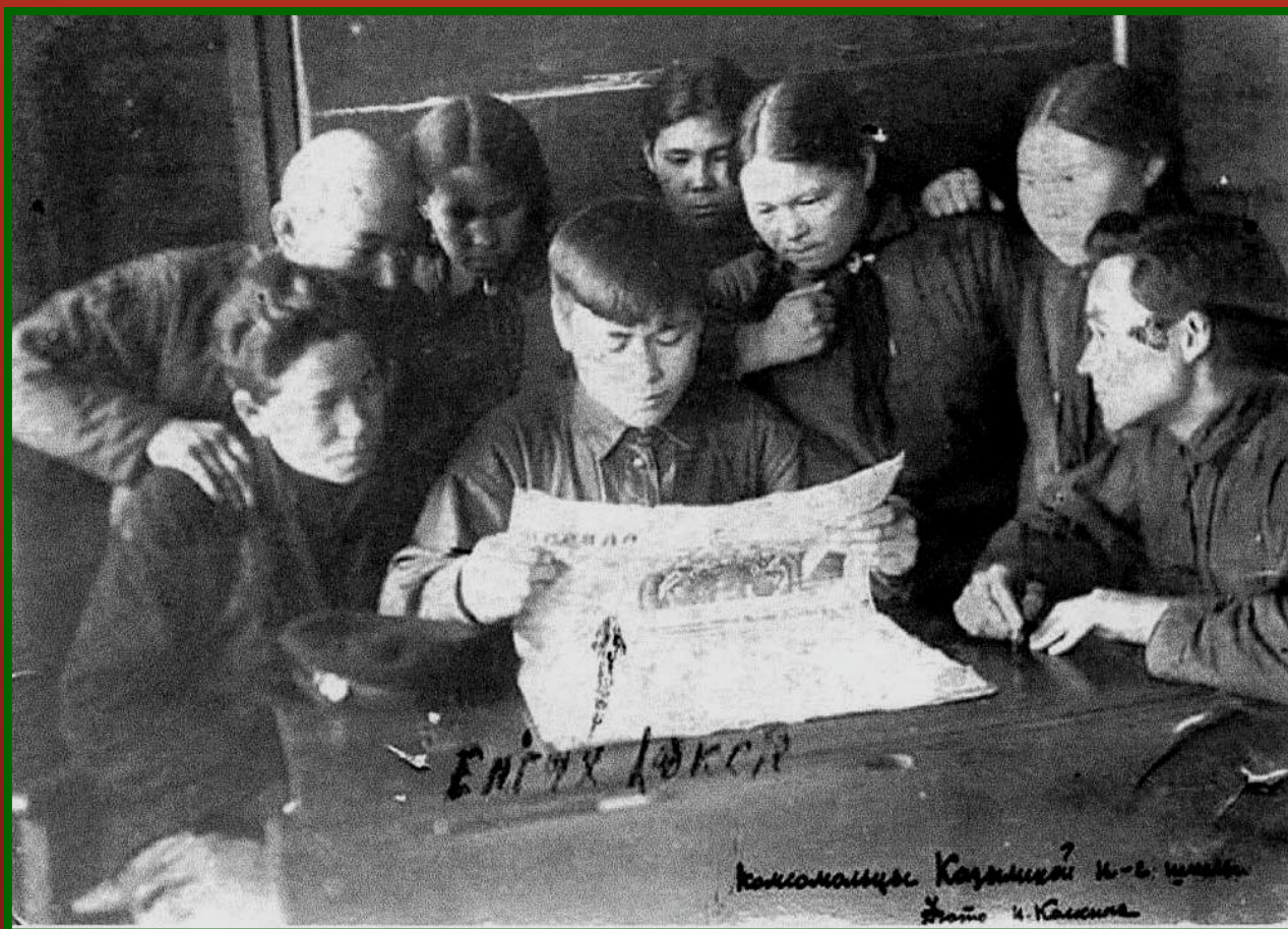
1930-е гг. Комсомольцы Казымской школы за чтением газет