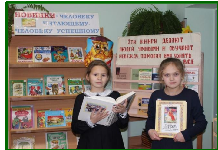
2015 г. библиотеки.