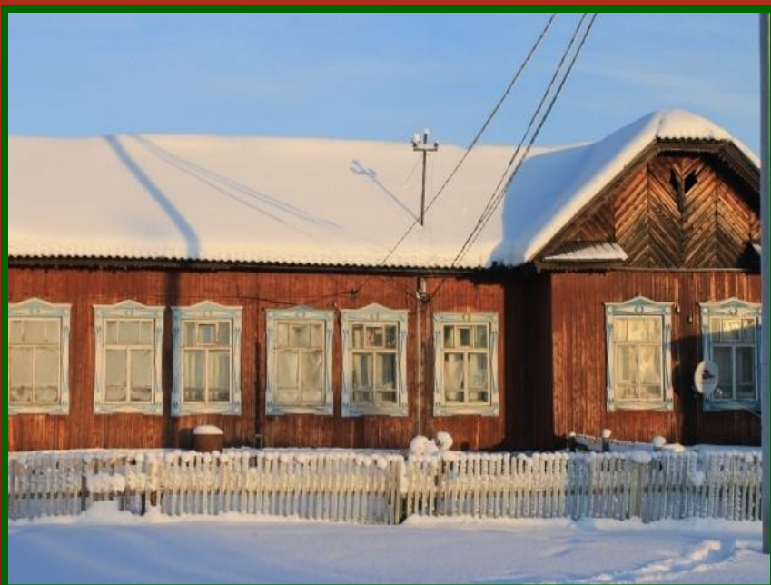
2008 г. Ул. им. В. И. Каксина. Здание Администрации с. Казым, в котором расположена сельская библиотека.