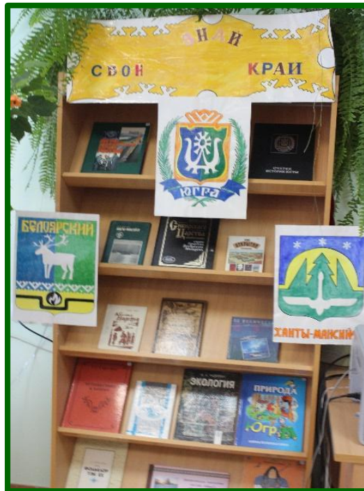
2016 г. Выставка в библиотеке.